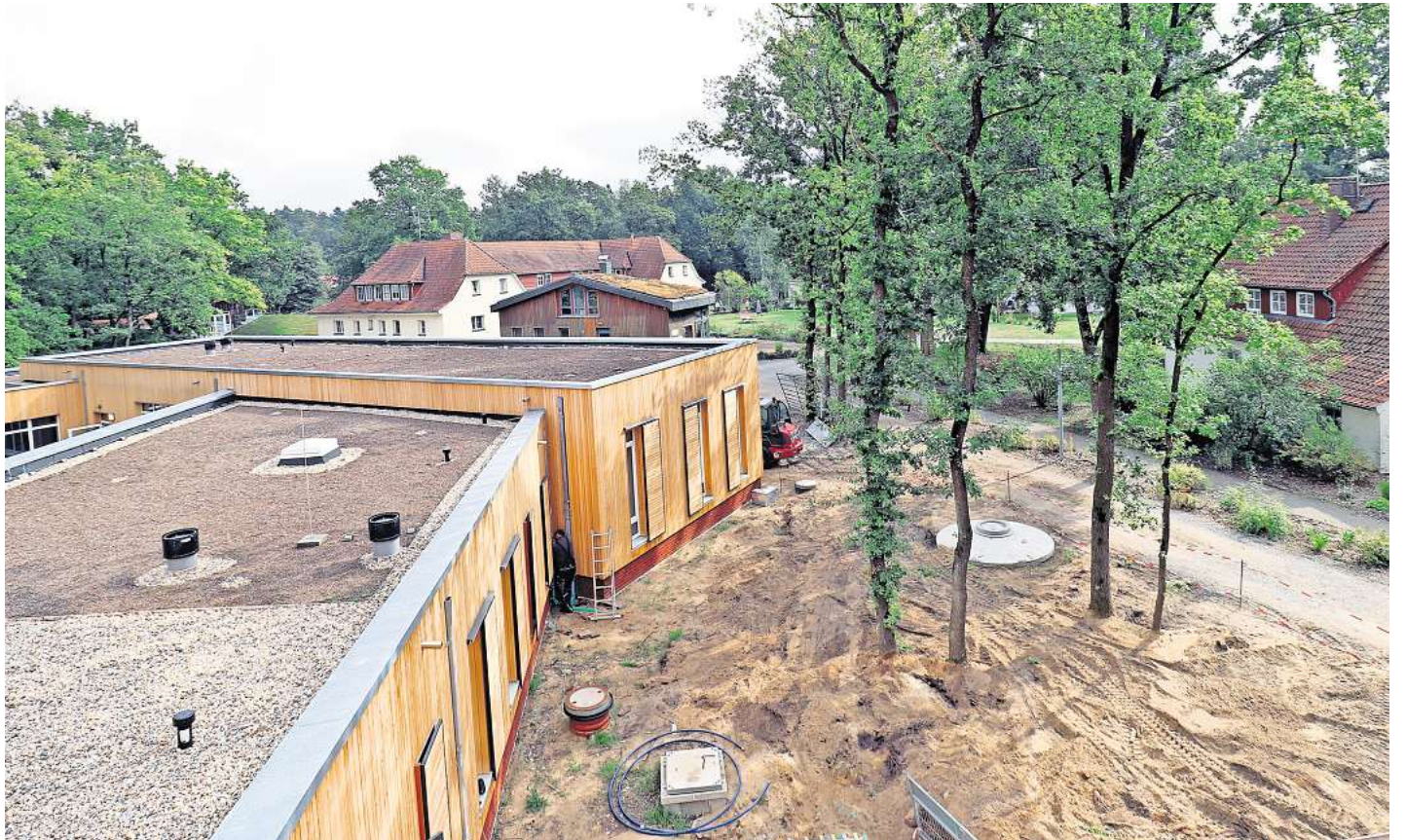
Der weitläufige Standort des Albert-Schweitzer-Familienwerks an der Sägenförth in Hermannsburg.